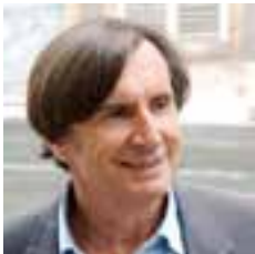
Daniel Rondeau: Académicien Français, Diplomate, écrivain.