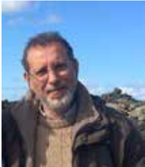
Giosuè Calaciura Scrittore/Ecrivain