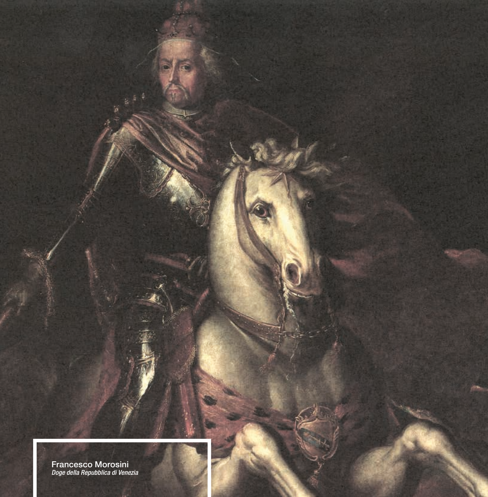
Francesco Morosini Doge della Repubblica di Venezia